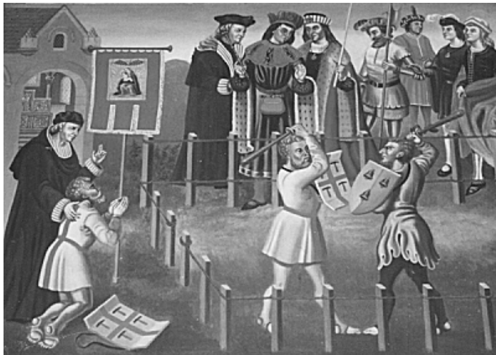
Le duel entre Guillaume et le forgeron d'Estinnes Tableau originaire de l'abbaye de Cambron

Les documents contenus dans les archives montoises confirment donc, en tous points, les sources contemporaines du sacrilège de Cambron. Ils permettent de suivre la carrière de Guillaume à partir de 1310 et de lui donner une dimension plus concrète et plus humaine.