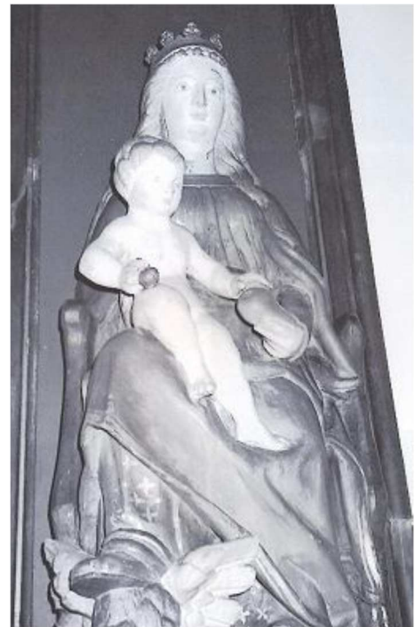
Notre-Dame de Cambron Eglise Sainte-Elisabeth