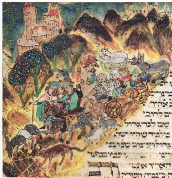
Juifs expulsés d'une cité allemande (1427-1428)