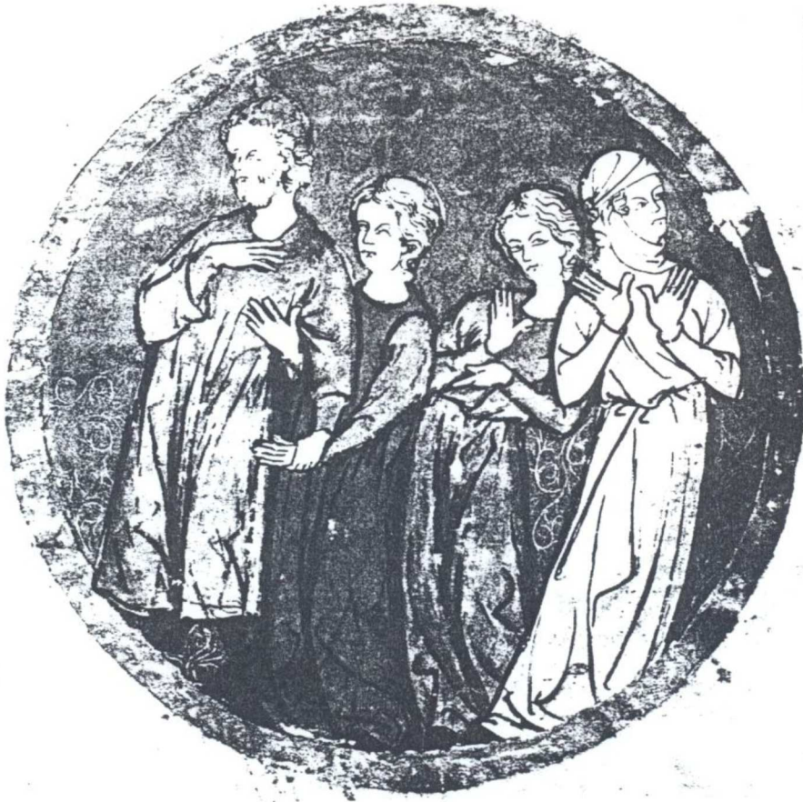
Costumes portés par les Juifs du Nord de la France au XIV e siècle Londres, British Library