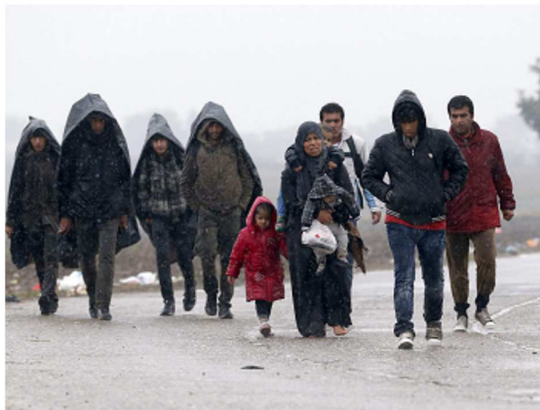
Migrants à la frontière entre la Serbie et la Croatie octobre 2015