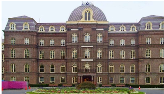
Vassar College est actuellement une université privée mixte, située à Poughkeepsie, dans l'État de New York