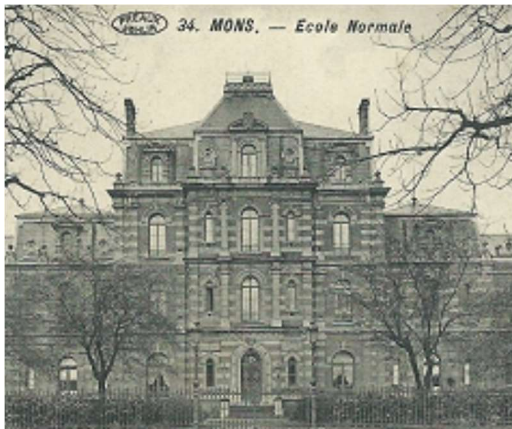
Le bâtiment central de l'École Normale