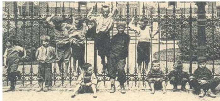
Cette carte postale datée des environs de 1900 montre des enfants désœuvrés devant les grilles de l'École Normale. En agrandissant le groupe à l'avant-plan, on s'aperçoit que plusieurs garçons ne portent pas de chaussures. Sans doute s'agit-il des enfants pauvres dont il est question plus haut.