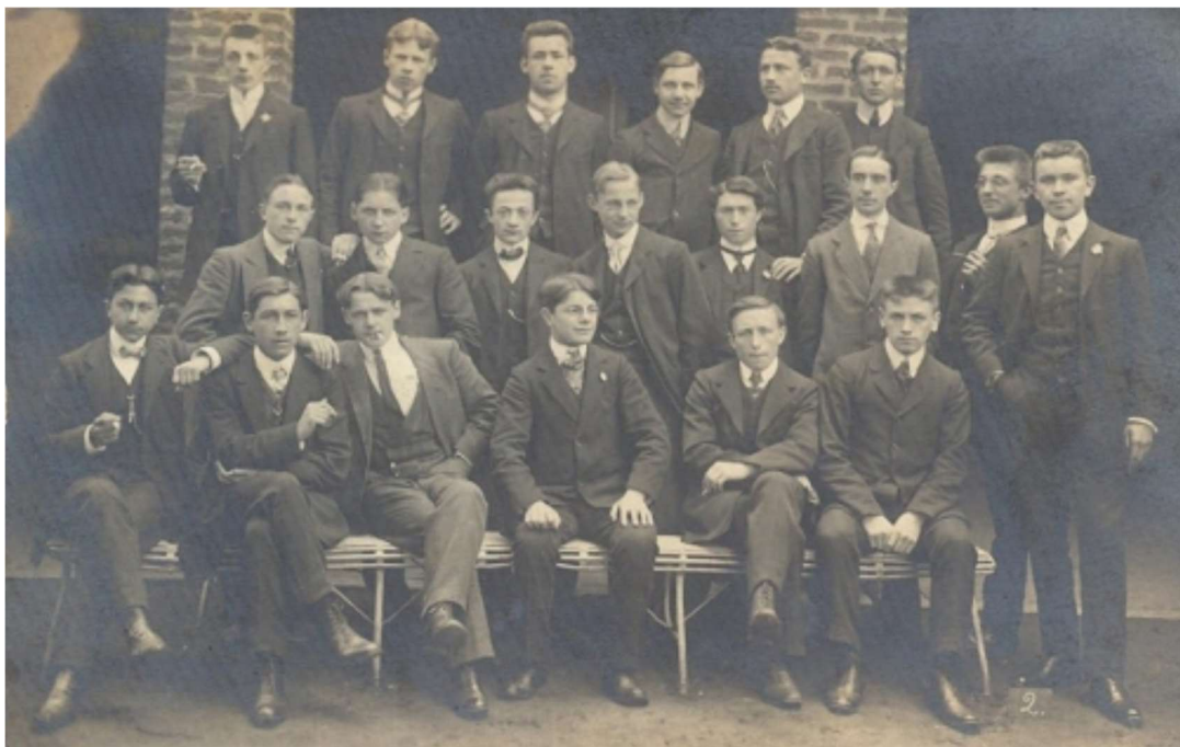
Une classe de « normaliens » vers 1908

Les critères d'admission ne sont pas trop exigeants : avoir un diplôme d'école primaire, être âgé de 16 ans au moins et de 22 ans au plus, être de conduite irréprochable, avoir une bonne santé et se tenir à la disposition du gouvernement pendant 5 ans dès la réussite des études.