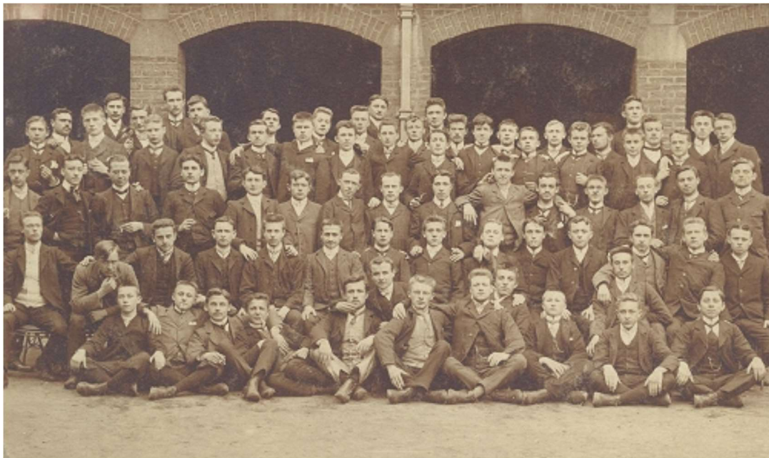
Les pensionnaires (vers 1908)

néanmoins que les élèves reçoivent tous les jours de la viande et des légumes cuits et espérons que le pain de 1884 était complet et riche en fibre et en vitamine B.